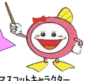
下水道マスコットキャラクター

令和8(2026)年度公益財団法人とちぎ建設技術センター職員の採用試験を次のとおり行います。